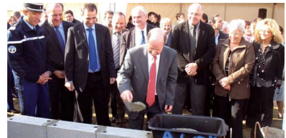
23/10/2008 : Pose de la première pierre de la Brigade Beauzelle-Blagnac Constellation

Les locaux répondront aux normes de qualité environnementale d'Andromède et les travaux sont menés dans le cadre d'un chantier « propre ».